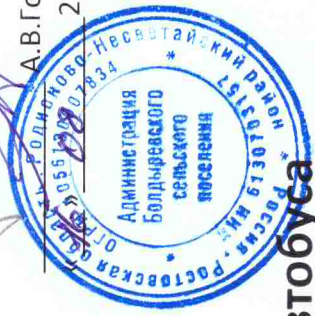
Схема маршрута движения №2 школьного автобуса МБОУ Дарьевская СОШ х. Дарьевка – х. Болдыревка